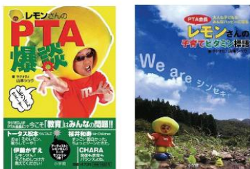
『レモンさんのPTA爆談』 『PTA会長レモンさんの子育てビタミン標語』(小学館)

大きなレモンの被り物をし、「レモンさん」というキャラクターで小学校のPTA会長を5年間務め、その後もPTA顧問を続けている。NHK Eテレ「みんなのためのバリアフリーバラエティー“バリバラ”」の司会でも活躍中。